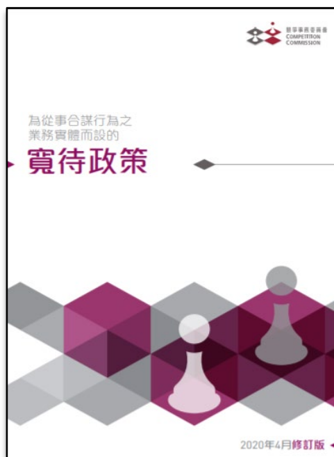
《業務實體寬待政策》

《寬待政策》旨在向從事或牽涉入合謀行為的業務實體及個別人士，提供強烈、透明和可預計的誘因，使其停止有關行為、向競委會舉報並提供合作。